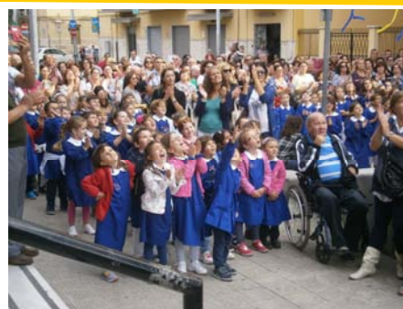
GLI ALUNNI della I^ E-F