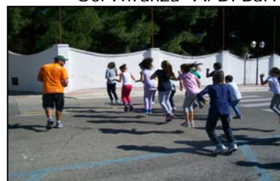
GLI ALUNNI IMPEGNATI NELL'ATTIVITA' SPORTIVA